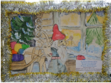
2 место. Мирзоян Варвара, 6 лет