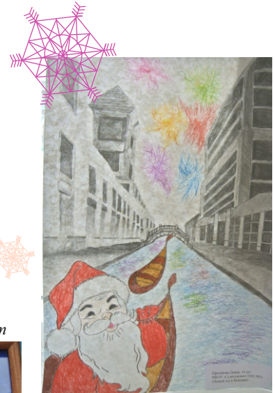
1 место. Прохорова Диана, 14 лет