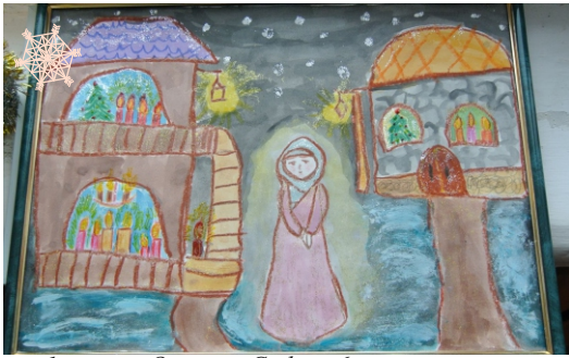
1 место. Оситова София, 6 лет