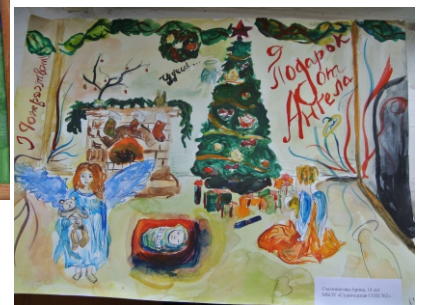
2 место. Смолоногова Арина, 14 лет