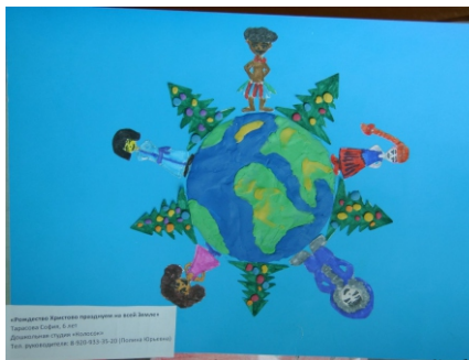
2 место. Тарасова София, 6 лет