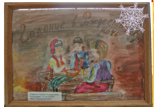
3 место. Гончар Дарья, 11 лет